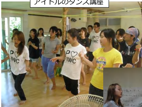
アイドルのダンス講座