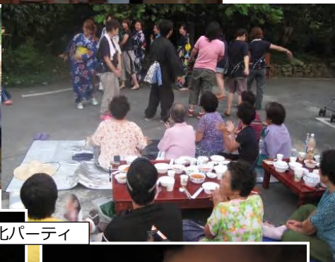
日本文化パーティ