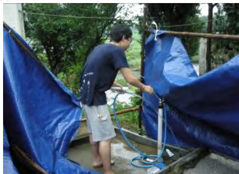
台風でブルーシートシャワーが...